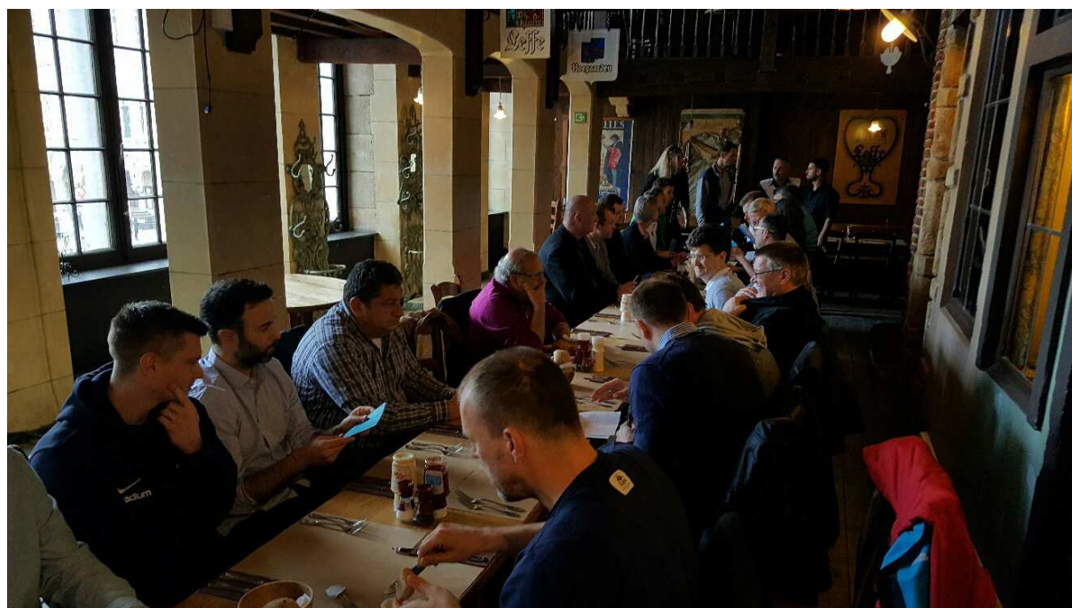
Společná večeře v restauraci na náměstí Grand Place.