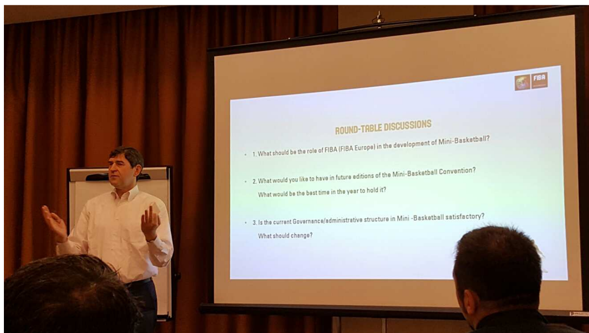
Předseda mládežnické komise FIBA Aris Zois prezentuje hlavní body diskuze „ u kulatých stolů“.